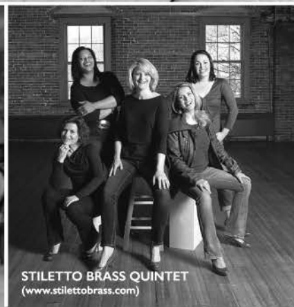
STILETTO BRASS QUINTET ( www.stiletto brass.com )