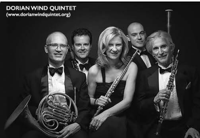
DORIAN WIND QUINTET ( www.dorianwindquintet.org )